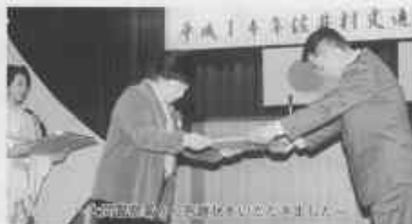
～交通安全賞の表彰を受けました～