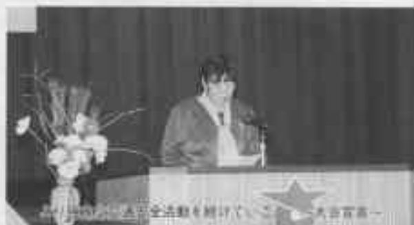
～交通安全活動を続けていこう～