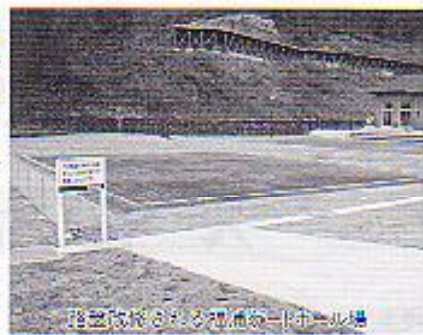
除塵改修が予定されているゲートボール場