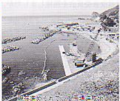
現在進められている海水浴場の設置

回答 地区からの要望により現在の場所を干場造成したことから、今まで利用していた場所が使えなくなり、新たな海水浴場の適地調査をしたが見つからなかつたので、地区の方で考えて頂きたい。