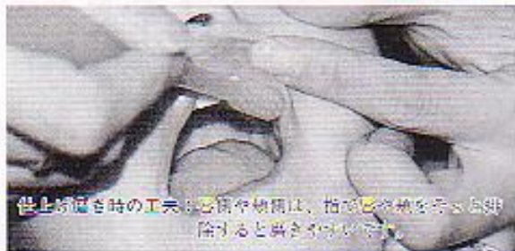
仕上げ磨き時の工夫:虫歯や歯痛は、指で歯を触ると痛みが増えるので歯磨き剤を塗る。