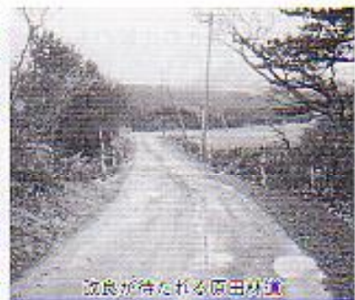
改良が待たれる原田林道

回答 約二百名の道路改良が必要となり、事業費が多額となるため、舗装改良等は考えていない。但し、利用者の利便性を確保するため、除草と除雪については実施する。また、幅員が狭いことから車両の交差に支障があるので地権者の協力が得られれば、待避所の新設を考えたい。