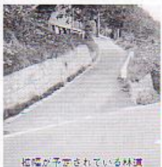
拡幅が予定されている林道