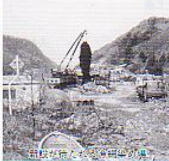
新設が予定されている漁網染め場