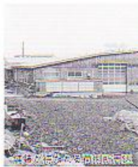
荷捌場周辺の舗装

回答 必要には理解出来るが、財政上当然実現出来ない。採石が飛び散るとのことについては、付近を通行する際はゆっくり走行するなど配慮をして頂きたい。