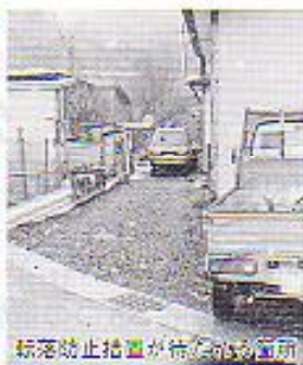
転落防止措置が予定されている箇所