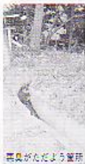
悪臭がたどよう悪質

回答 流末処理に原因があるため悪臭がするものと思われる。古佐井川河川改修の一環として側溝の延長を土木事務所にて要望しているが、枯れ葉等が側溝に堆積し排水処理が悪くなることもその一因と考えられるので、これらの除去については周辺の方の協力をお願いしたい。