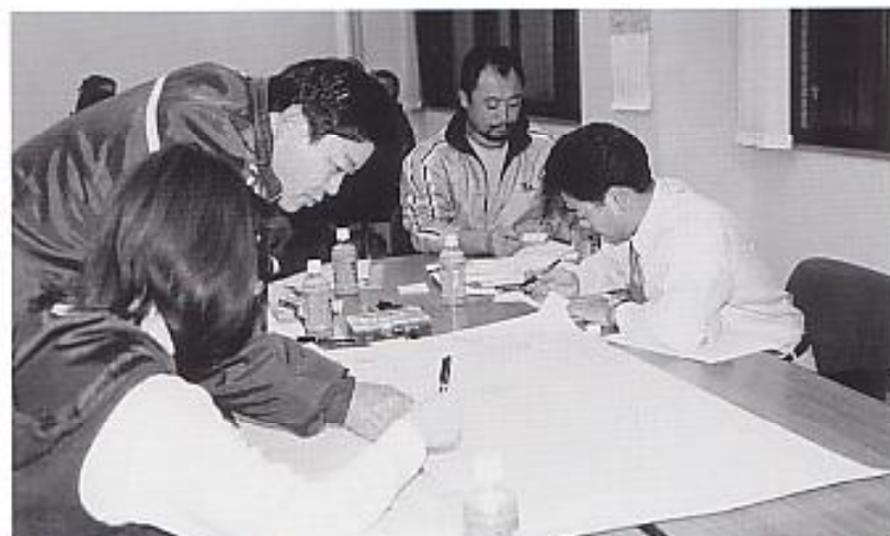
『基盤整備・産業部会』は道路や公共交通をはじめ私達の生活に関連するものや環境、行政そして産業をテーマに話し合いを進めています。

市町村合併課題に向け、「まちづくり」について話し合う「わがまちづくり委員会」（プロジェクトチーム）の活動状況を紹介します。 「わがまちづくり委員会」は、『基盤整備・産業部会』『健康・福祉部会』『教育・文化部会』の三部会で、それぞれのテーマに従ってワークショップ形式により会議を進めています。