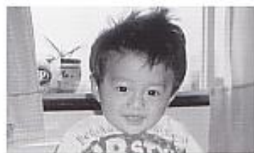
横濱 一 かずみ 望くん (亨・サリオ アミイ) 磯谷