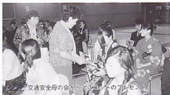
交通安全母の会から子どもへのプレゼント