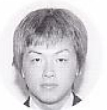
金沢 偉人 (原 田)