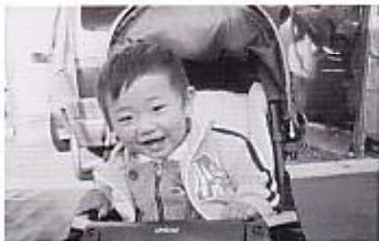
たいち 横浜 太地くん (芳彦・隆子) 磯谷