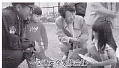
～交通安全家族会議～