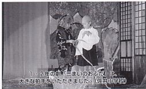
1・2年の劇「三まいのおふだ」は、大きな拍手をいただきました。(浜井小学校)