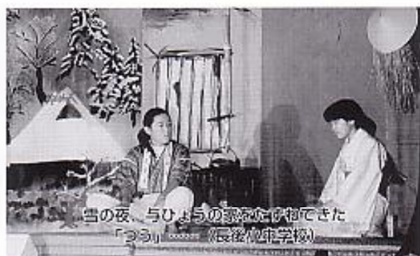
当の夜、与ひよりの歌をたけ物できた 「つる」……(長後小中学校)