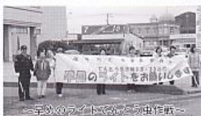
～早めのライトでんたろう虫作戦～