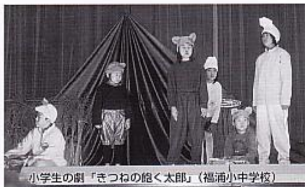
小学生の劇「きつねの飽く太郎」(福浦小中学校)