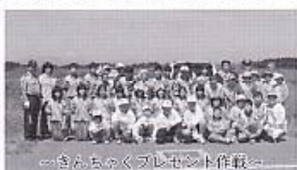
～みんなのくまのプレゼント制作～