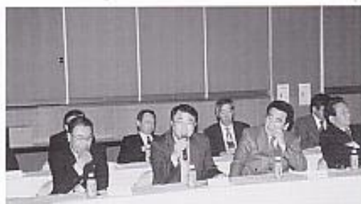
今後の地域交流について活発な意見交換が行われました

などのさまざまな意見が出され、今後も、地域間交流を継続していくことを確認しました。