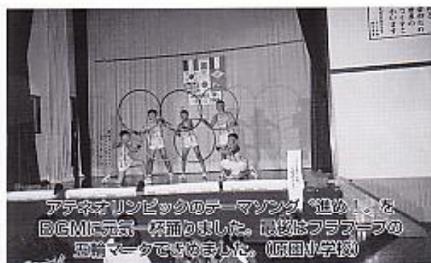
アテネオリンピックのテーマソング「進め！」をBGMに元気一杯踊りました。最後はフラフラの笑顔マークでお楽しみました。(原田小学校)