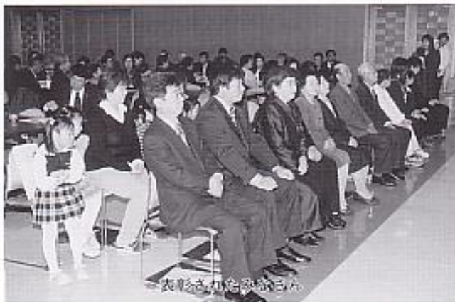
表彰された受賞者

また、ウォーキング大会やグランドゴルフ大会等のさまざまなイベント、食生活改善推進員による試食コーナー、青年赤十字奉仕団によるバザーや炊き出しも行われるなど、住民のみなさんは、保健福祉の向上や健康づくりに対する意識をより一層深めていました。