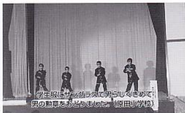
学生服にサンダンスで男らしくきめて、男の熱意をおどりました。(原田小学校)