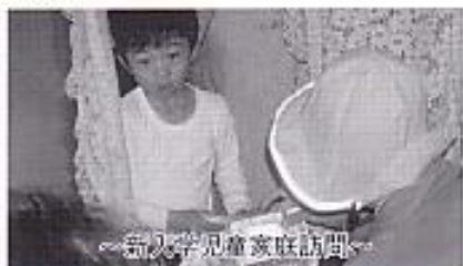
～新入学児童家庭訪問～

来年も母の会は交通死亡事故の絶対阻止・子供やお年寄りの交通事故撲滅に向け て積極的な活動をしていきたいと思っておりますので、みなさんの温かいご協力をお願い します。