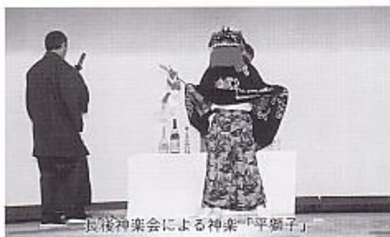
長後神楽会による神楽「平獅子」