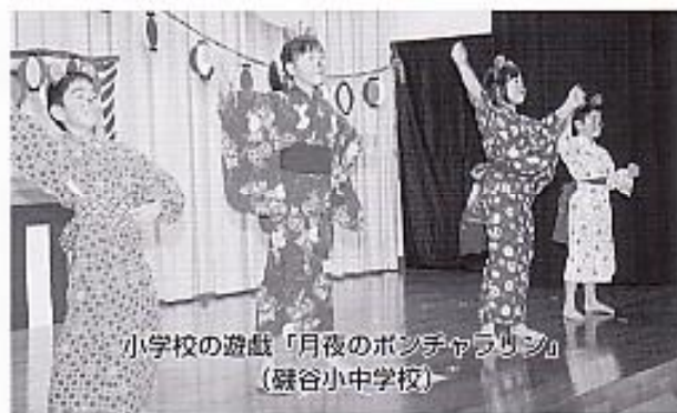
小学校の遊戯「月夜のボンチャラリン」 (磯谷小中学校)