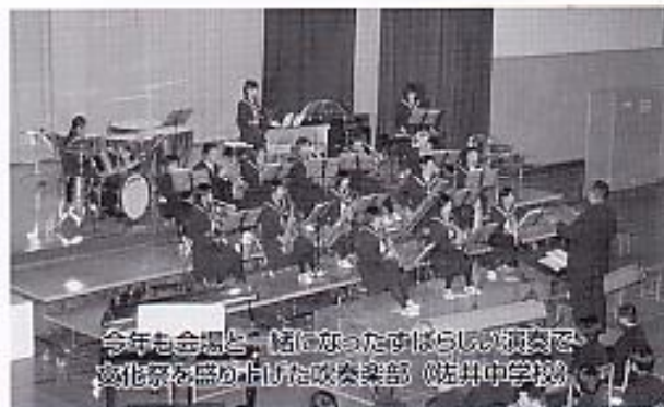
今年も金鼓と一緒に楽しんだすばらしい演奏で文化祭を盛り上げた吹奏楽部。(海井中学校)