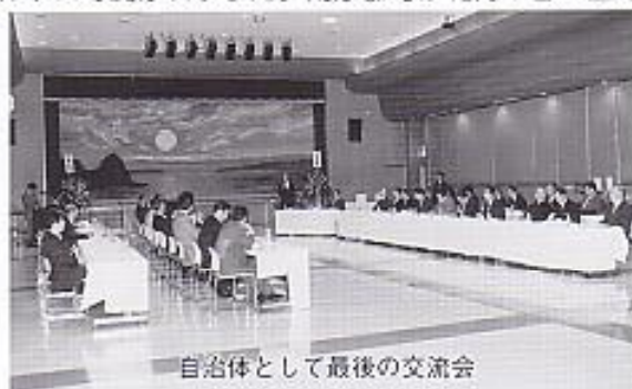
自治体として最後の交流会

また、引き続き行われた懇談会では、磯谷敬神会のみなさんが「きつね踊り」、佐井村議会議員が「白浪五人男」、佐井村職員有志が「祭り囃子」をそれぞれ披露し、感謝の気持ちを表現しました。