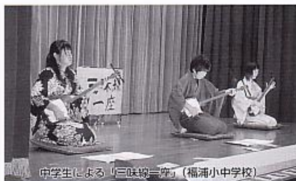
中学生による「三味線一庄」(福浦小中学校)