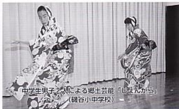
中学生男子2人による郷土芸能「しんもんがら」 (磯谷小中学校)