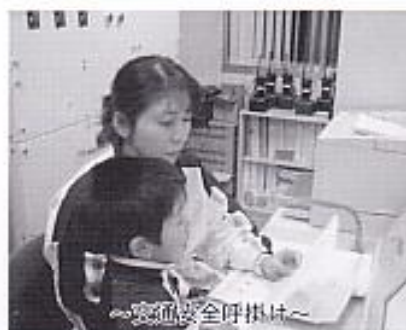
～交通安全呼び掛け～