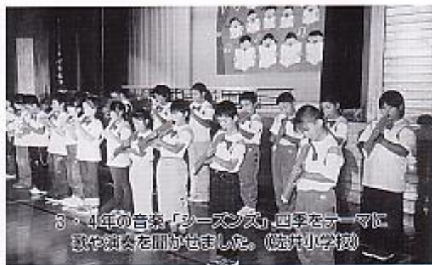
3・4年の音楽「シーズンズ」四季をテーマに歌や演劇を聞かせました。(海井中学校)