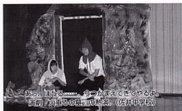
あ、ほたる……。今つがまえてきてやるよ。演劇「火垂るの虫」の熱演。(佐井中学校)