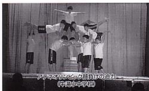
アテネオリンピック願いの迫力 (宇和川中学校)