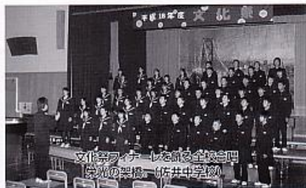
文化祭フィナーレを飾る全校合唱「空の架橋」。(佐井中学校)