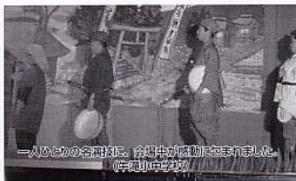
一人ひとりの名演技に、会場中が感動に包まれました。 (宇和川中学校)