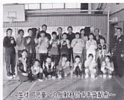
～生け花・児童への感謝状制作の手伝い～