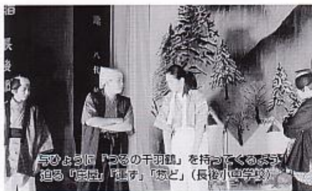
与ひよりに「つるの千羽鶴」を持ってくるまふ 迫る「真柱」「種す」「おど」(長後小中学校)