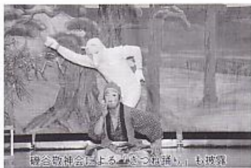
磯谷敬神会による「きつね踊り」も披露