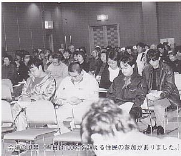
会場の風景 (当日は100名を超える住民の参加がありました。)