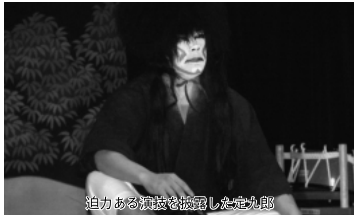
迫力ある演技を披露した定九郎