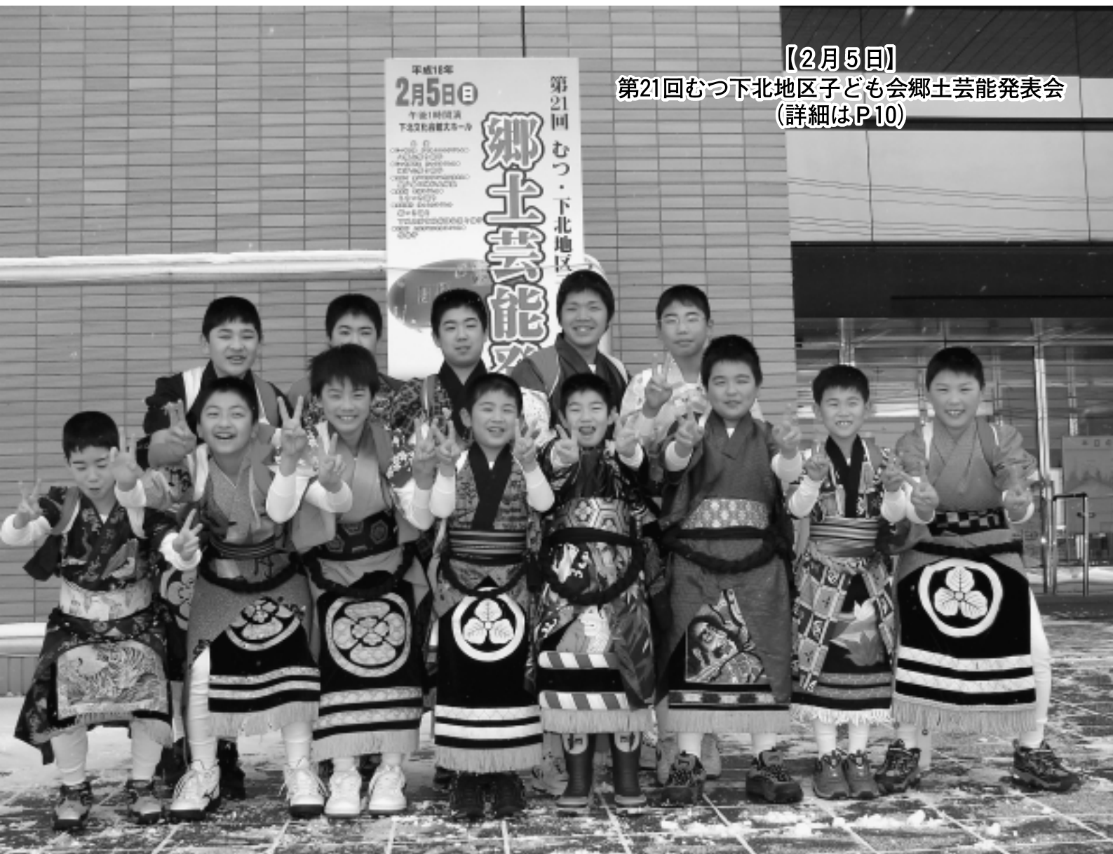
【2月5日】 第21回むつ下北地区子ども会郷土芸能発表会 (詳細はP10)