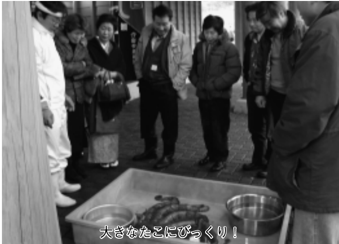
大きなたこにびっくり!

2月18日(土)、毎年恒例の福浦の歌舞伎「食談義」が歌舞伎の館で行われました。三番叟で幕開けし、矢越福浦漁協婦人部による「佐井音頭」で閉演しました。県内外から来た100名近い参加者は、日頃見ることの