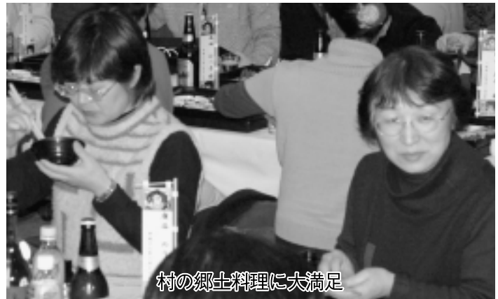
村の郷土料理に大満足