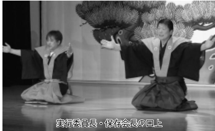
実行委員長・保存会長の口上