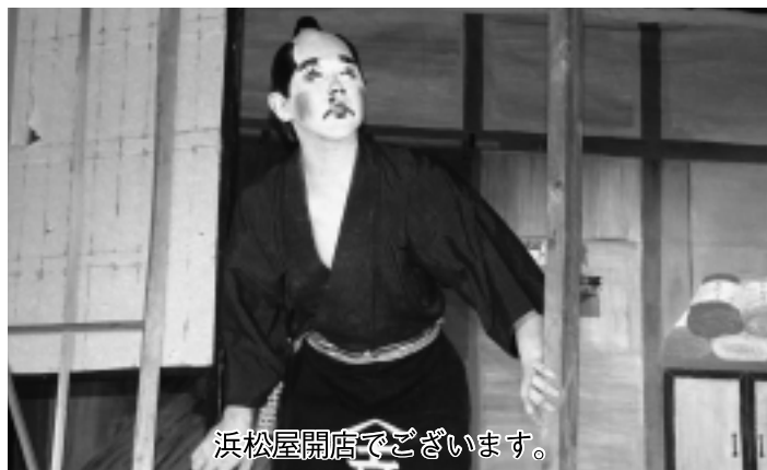
浜松屋開店でございます。