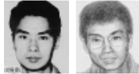
現在のイメージ画