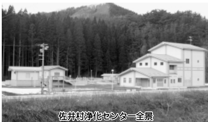
佐井村浄化センター全景

処理場では、供用開始した地域内からの汚泥を一括に処理することができますが、加入者が少ない場合には処理場の機能が十分に発揮されないこととなりますので、是非とも早期に加入していただきますようお願いいたします。