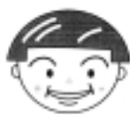
口唇の横引き運動 (自由自動運動)