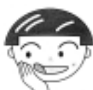
舌の左右運動時、誤って下顎も動いてしまうときは下顎に手を添える

体や健康を維持するためには、リハビリや体の体操が必要です。おいしく食事したり、楽しく会話するためには唾液や舌の動きが大切です。