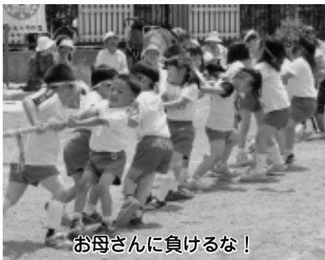
お母さんに負けるな!