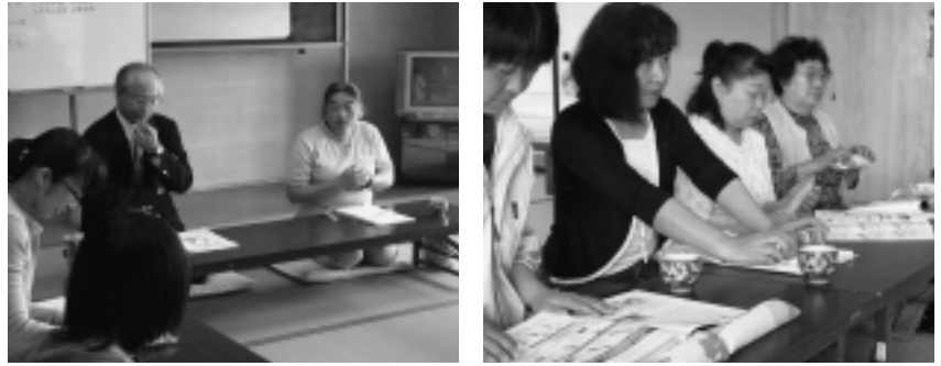
～総会、研修会の様子～