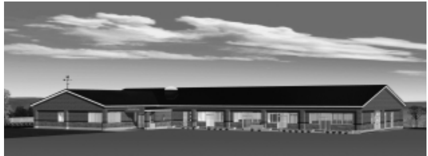
保育所完成予定図

この度、建築及び外構設計が終了したことから、今後、平成22年3月の完成に向けて、建設工事が開始されます。