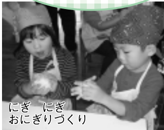
にぎ にぎ おにぎりづくり