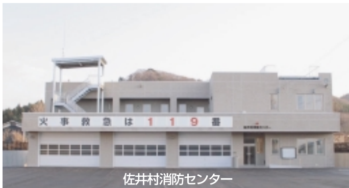
佐井村消防センター