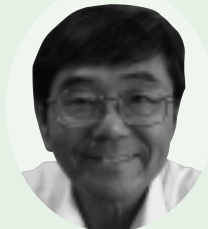
おと 大佐井 出身 みき 東京 都 在住