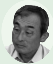
よいち 大佐井 出身 おくと 埼玉 県 在住