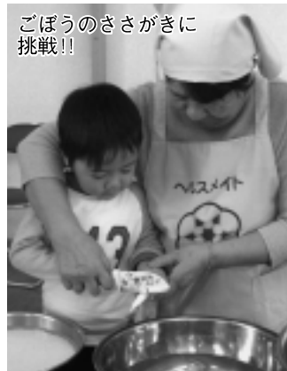
ごぼうのさがぎに 挑戦!!