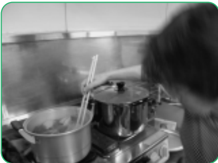
紅茶やコーヒーを使った染め物に挑戦！