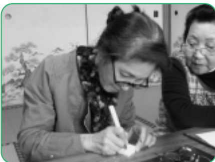
消しゴムにうさぎや花、屋号などを 彫刻刀でほって、はんこを作りました。