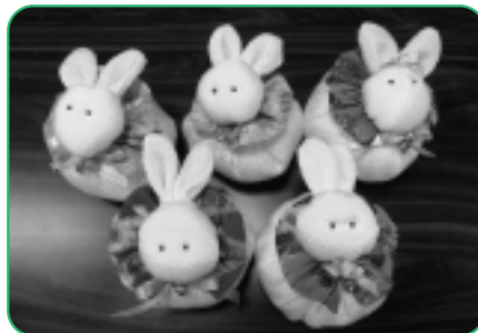
かわいいお手玉が出来上がりました。