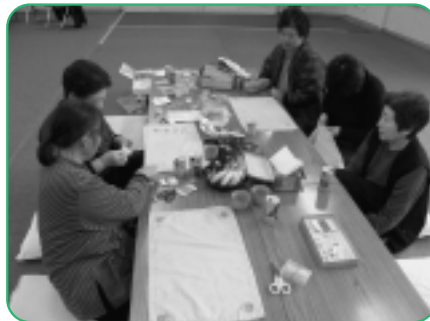
自分たちで染めた布に、刺繍をしたり、 消しゴムはんこを押したりして、ラ ンチョンマットなどを作りました。