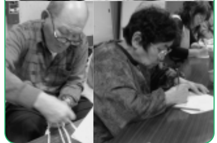
“陶芸”“大人の塗り絵”“布ぞうり 作り”“お手玉作り”などいろい ろなプログラムを用意しています ので、自分たちがやりたいものを選 んで参加することもできます。