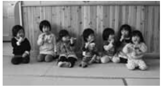
今回の仕上げの様子では、上の前歯を磨かれるのを嫌がる幼児が何名も見られました。

乳歯は2才から2才半くらいで(20本)生えそろういます。生えたての歯は歯の質がまだ弱くむし歯になりやすいことから、この時期にフッ素塗布することで生えたての歯を強化することが出来ます。もちろん、食べた磨くが虫歯予防の基本ですが、歯磨き+フッ素もおすすめします。