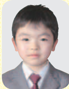
①よこはま しゅう ②じよせつしゃのうんてんしゅ