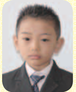
①よこはま たくみ ②こうじげんぱのしごと