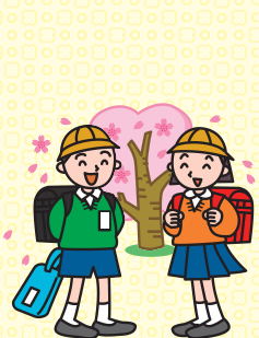
①きたの そら ②おはなやさん