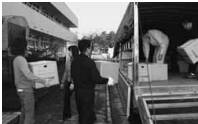
職員による積み込み作業

住民のみなさんから提供していただいた救援物資は、3月31日(木)、青森県災害対策本部・被災地域救援物資受付窓口をとおして、陸上自衛隊青森駐屯地に無事に搬入を終え、岩手県の被災地の方々へ届けられました。また、佐井村青年赤十字奉仕団からは、救急箱セットなどが送られました。