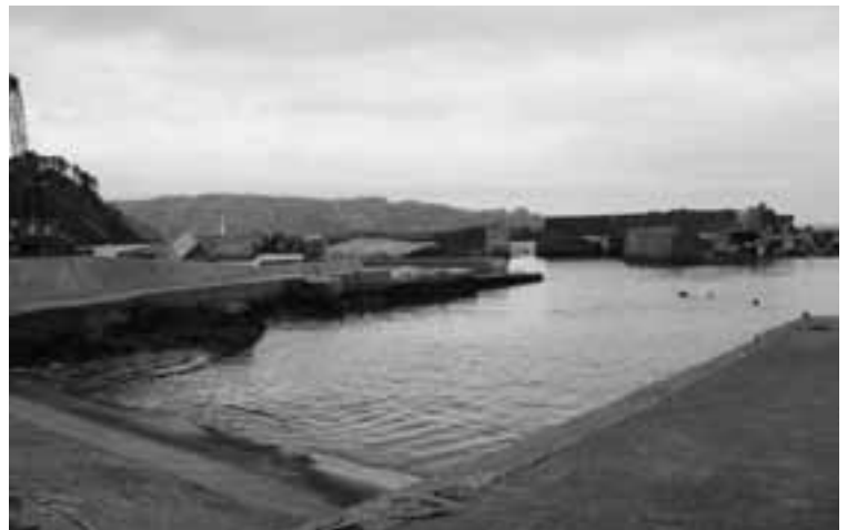
田野畑村・島越(しまのこし)の被災状況(漁港)