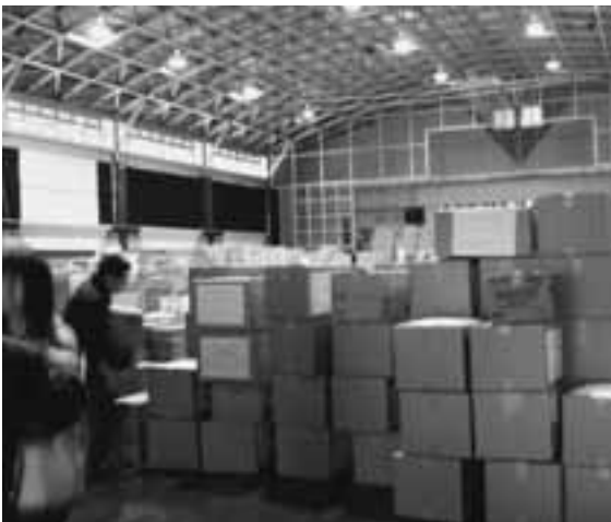
田野畑村に届けられた支援物資