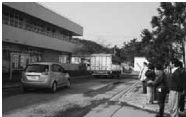
出発式を終え、救援物資を載せて青森へ