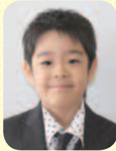
①わかやま おうだい ②おいしゃさん