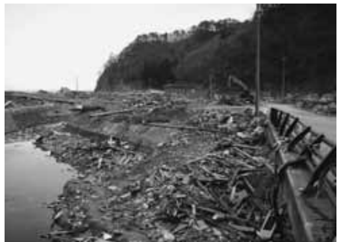
田野畑村・島越(しまのこし)の被災状況