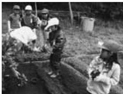
学校菜園の苗植え