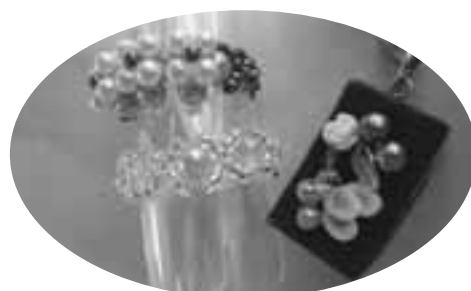
左) 受講生の作品 右) 講師からのお土産 (フェイクスイーツのストラップ)

小さなビーズに手芸用のテグスを通す作業がうまくいかなかったり、ビーズを入れた皿をひっくり返したりと、ハプニングもありましたが完成品にみんな満足していました。