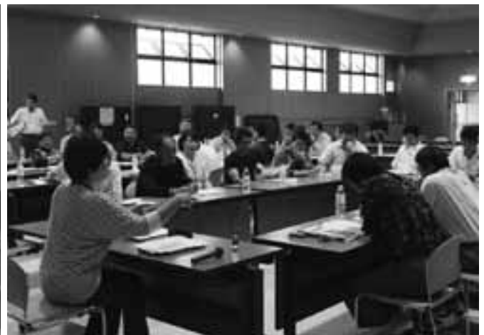
▲ワーキング・グループ会議での意見交換の様子