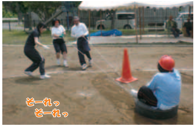
ぞーれっ ぞーれっ