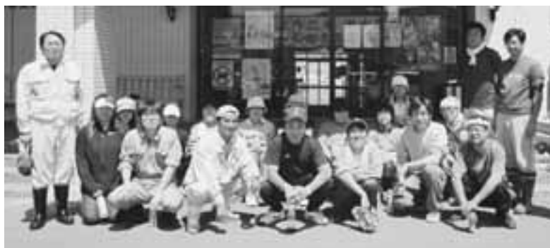
早朝から大変おつかれさまでした！