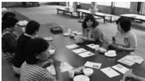
7月21日（木）牛滝地区健診結果説明会で、うす味や野菜たっぷりの料理を紹介しました。