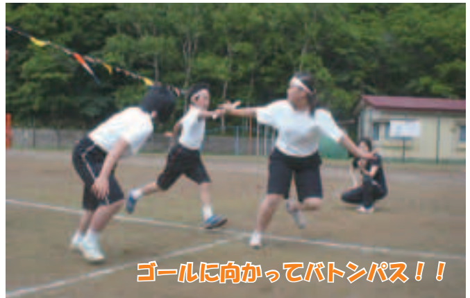
ゴールに向かってバトンパス！！