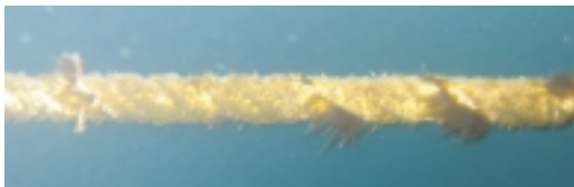
▲約1ヶ月後：育ち始めたわかめ(11月29日撮影)

5月18日(金)昨年11月3日に種付け作業を行い、今年3月31日に収穫した「弁天わかめオーナー制度」の養殖わかめの塩蔵加工が終わり、村内外のわかめオーナー98人に「塩蔵わかめ」を発送しました。本オーナー事業は今年度も実施する予定です。