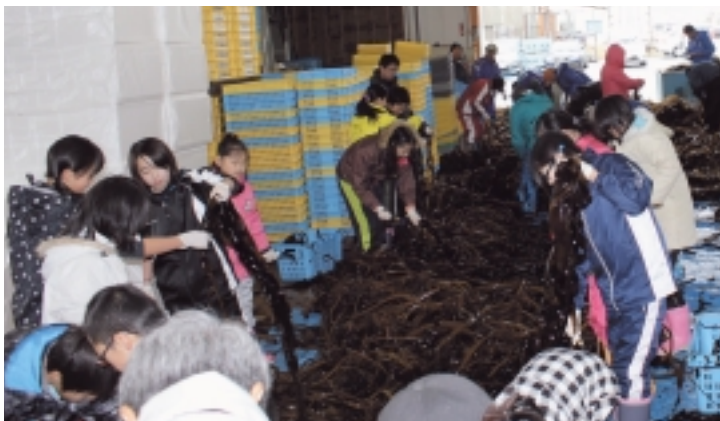
▲「わかめ収穫体験」の様子(3月31日実施)