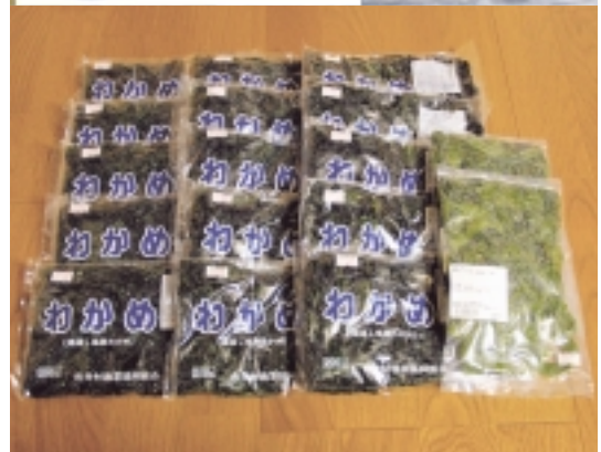
▲発送した塩蔵わかめ(左)と茎わかめ(右)