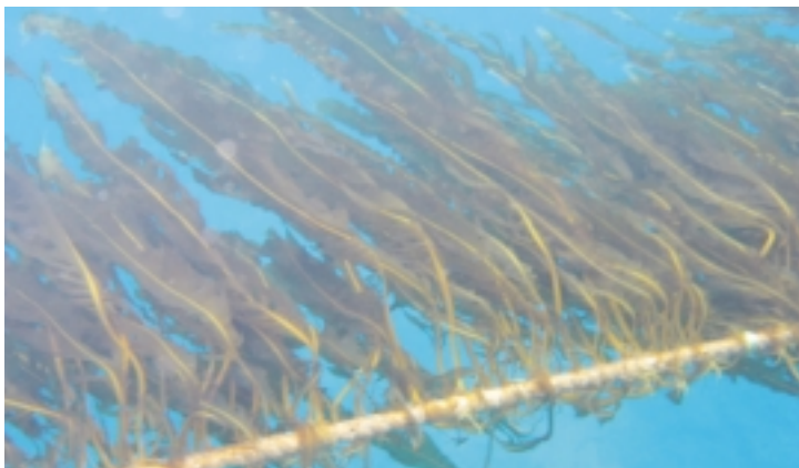
▲約2ヶ月半後：順調に大きく生長したわかめ(1月20日撮影)

5月18日(金)昨年11月3日に種付け作業を行い、今年3月31日に収穫した「弁天わかめオーナー制度」の養殖わかめの塩蔵加工が終わり、村内外のわかめオーナー98人に「塩蔵わかめ」を発送しました。本オーナー事業は今年度も実施する予定です。