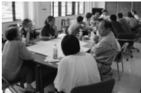
▲開発メニュー検討