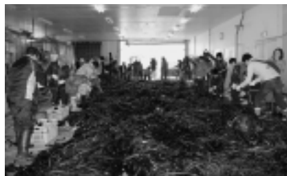
▲「わかめの収穫体験」の様子