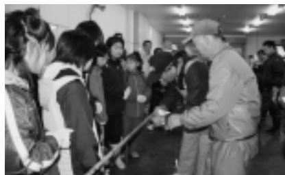
▲「わかめの種付け体験」の様子