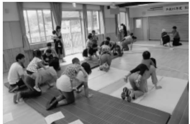
親子のふれあい講座「親子で楽しむからだ遊び」