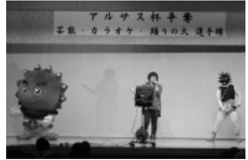
アルサス杯で踊りを披露

1月26日(日)にはむつ市で「下北食の祭典」、2月23日(日)の「アルサス杯カラオケ大会」に登場し、華麗なダンスを見せていました。