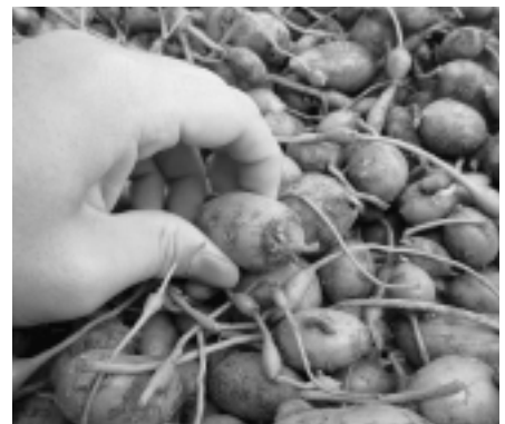
収穫されたアピオス