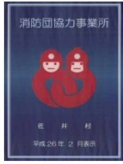
【消防団協力事業所表示証】