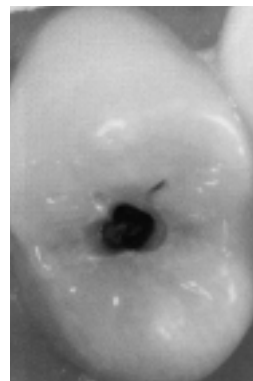
見た目は小さなむし歯でも、削ってみると意外と大きなむし歯になっています。