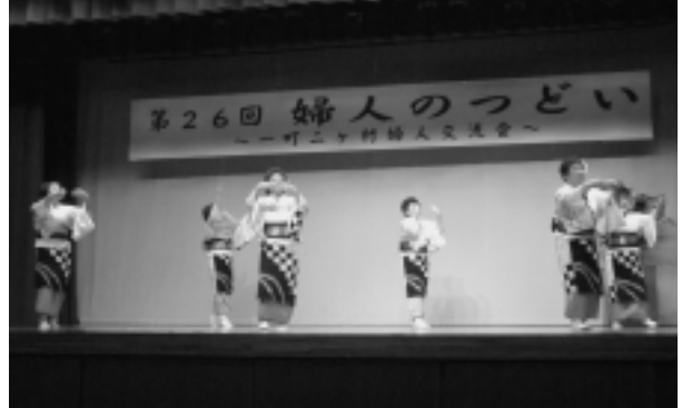
▲大間地域婦人会「ドンパン節」