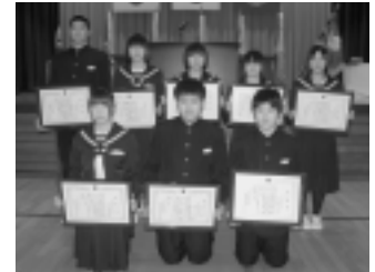
▲佐井中学校受賞者