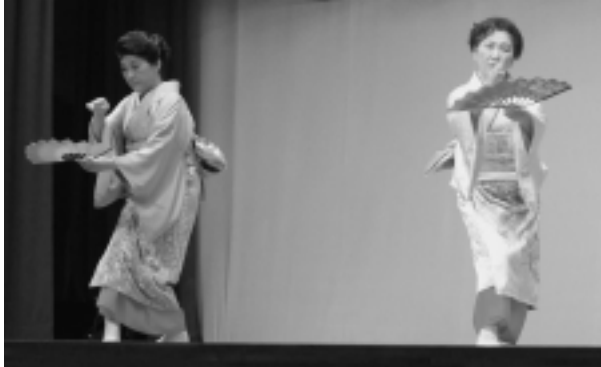
▲佐井婦人会「春雨情話」

3月9日(日) アルサスで「婦人のつどい」が開催されました。佐井村地域婦人団体連合会、大間町女性団体連絡協議会、風間浦連合婦人会が一堂に会し活動報告を行なったほか、いきいき健康体操やアトラクションを楽しみました。