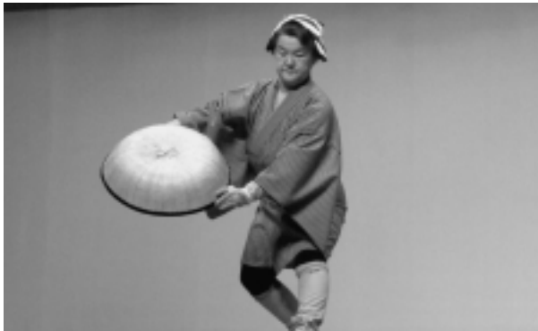
▲佐井村母子寡婦福祉協議会「番場の忠太郎」