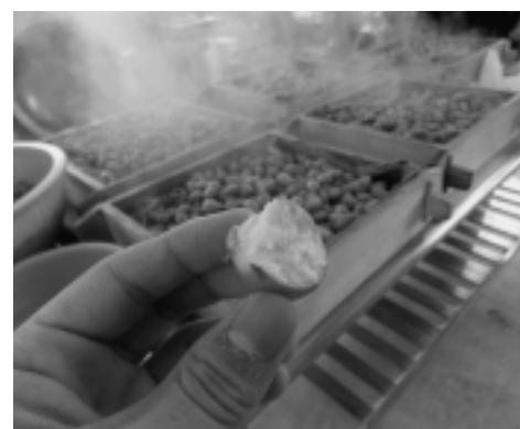
ほくほくなアピオス

そうして出荷しているので、甘いアピオスになります。佐井の人は佐井のアピオスしか食べないので違いを知る機会がないと思いますが、実はそうなんですよ！