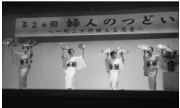
▲佐井村商工会女性部「平成音頭」