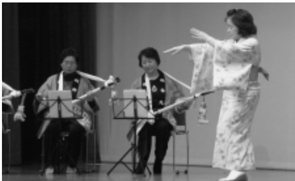
▲桑畑婦人会「千恵っ子よされ(スコップ三味線)」