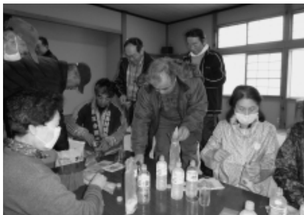
原田地区生活改善センターでの炊き出し訓練

3年前の3月11日に発生した東日本大震災を機に、地域の防災力や災害への備えの必要性を改めて感じた方が多いはずで、簡単に行える防災訓練の1つですので、地区で開催される際には、ぜひ参加してみてください。