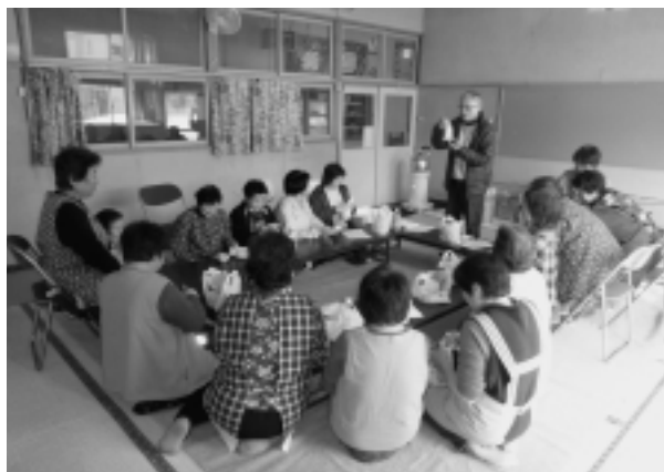
児童交流センター「ぼぼらす」での炊き出し訓練