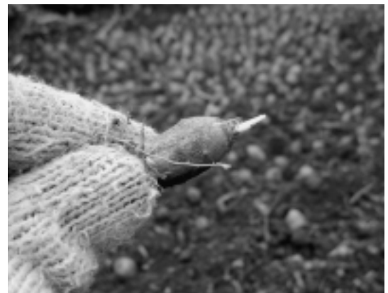
アピオスの芽出しをしているところ