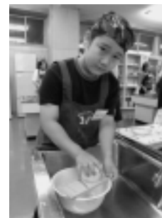
大根おろしをがんばります