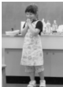
いただきますのごあいさつ