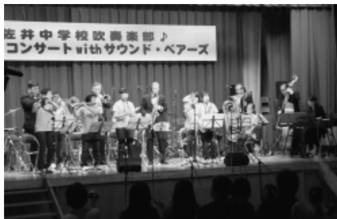
11月2日(日) ありがとうコンサート with サウンド・ベアーズ