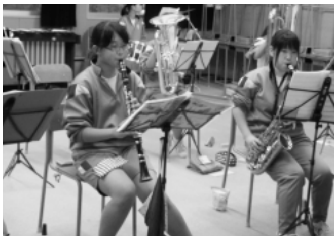
文化祭に向けての練習風景