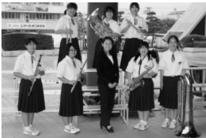
7月13日(日)「青森県吹奏楽コンクール第34回中央地区大会」