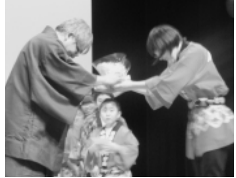
子ども会から芸能保存会へ花束を贈呈