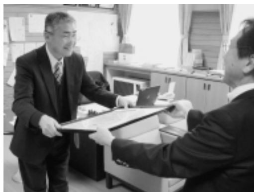
団体賞を受け取る和田校長