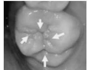
シーラントする前

*シーラントとは、むし歯になりそうな6歳臼歯の溝をむし歯になる前に白い薬で埋めてしまうものです。