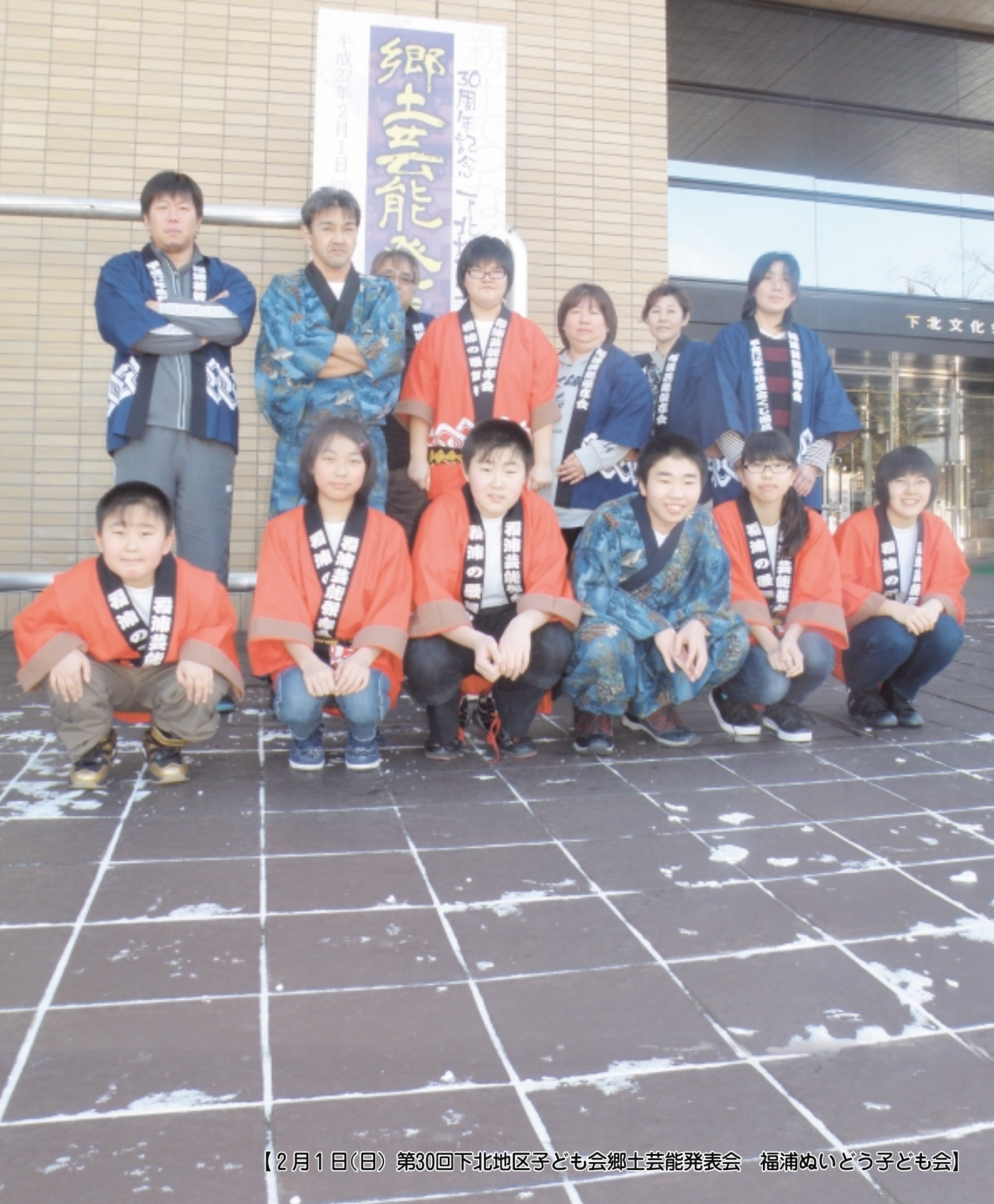
【2月1日(日) 第30回下北地区子ども会郷土芸能発表会 福浦ぬいどう子ども会】