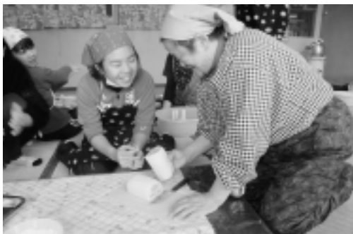
おばあちゃん、お花の模様ができたよ

出来上がったもちの一部は、子ども会活動にご協力いただいている東京多摩方面佐井出身者のみなさんに届けられました。