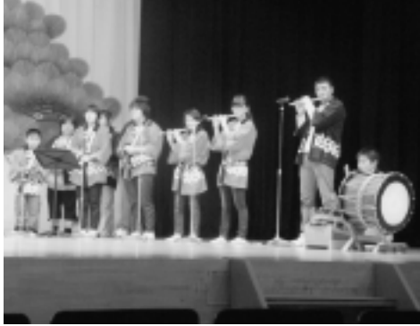
子ども会と芸能保存会が協力した「平獅子」

また、今回で30回目の公演となったことから、長年の感謝を込めて、子ども会員から指導者へ花束が贈呈されました。