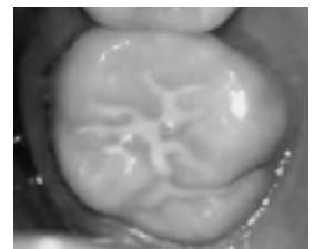
シーラントした後