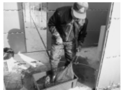
第一段階の踏み洗い

アピオスは、収穫してから販売までに、寒ざらし→洗浄→選別といった作業があります。アピオスは土の中にできるイモですから、洗うのも大変な作業です。ネットに入れて粗く踏み洗いをし、そのあと再度丁寧に洗うという二段階で洗っています。アピオスの栽培は下北中に拡大中ですが、佐井村の農家の作業は丁寧だと評判です。