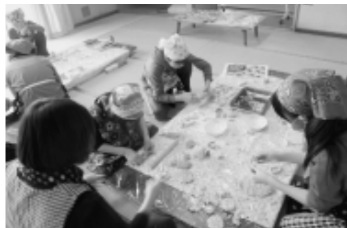
もちを型抜きしてデコレーション！