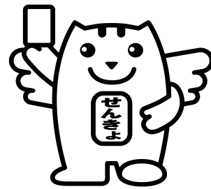
みんなの一票大切に!