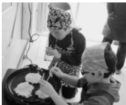
油の通る穴を開けるのがコツ