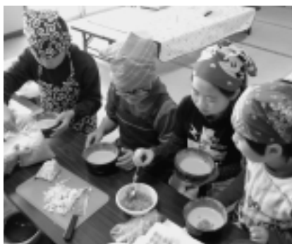
粉を混ぜて、天かすなどを入れます

粉を混ぜたり、キャベツを切ったり、慣れない作業に四苦八苦しながらもおいしいお好み焼きができました。持ち帰った児童の家庭からも、「とてもおいしかった」「作り方を子どもに教わった」と好評でした。