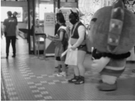
青森空港での観光客をお出迎え中

今月の雲丹（うんたん）は、7月末にはゆうなぎの里の夏祭り、大間町ウイングでの夏休みイベントに参加しました。8月に入ってからは、青森空港でのイベント、佐井村商工会夏祭りなど今月いろいろなところで活動してきました。