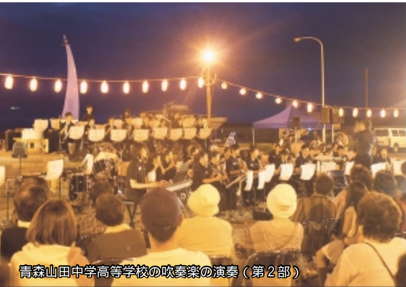
青森山田中学高等学校の吹奏楽の演奏（第2部）