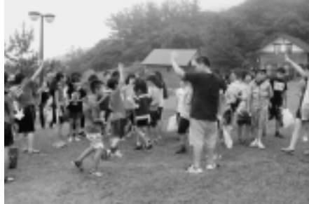
ケビンハウスにて