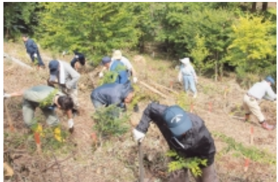
豊かな海は豊かな山から(植樹祭)

ジオパークに興味を持ち、知れば知るほど「地域のおもしろさ」や「地域のすごさ」に気づくことができるはず。ジオパーク活動を通して、まずは佐井村の地域の再発見からスタートしていませんか？