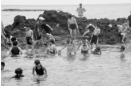
願掛公園海水浴場にて

西目屋小学校の5・6年生が佐井村を訪れ、村内の小学5・6年生とともに磯遊びやウニむき体験などで交流を深めました。