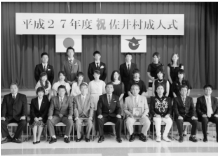
平成27年度成人式 記念撮影