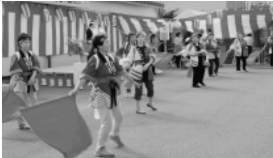
緑町・谷地町有志

8月1日(土) 社会福祉法人吉幸会「特別養護老人ホームゆうなぎの里」で夏祭りが開催されました。オープニングでは佐井村保育所4・5歳児による踊り、佐井中学校吹奏楽部による楽器演奏や全校生徒による合唱が披露されました。そのほか余興として、佐井村地婦連・大間町歌夢歌夢レディース・大間芸能保存会などによる踊り、カラオケ大会など多数の方々の演目に、会場の大勢の観客から大きな拍手が送られました。