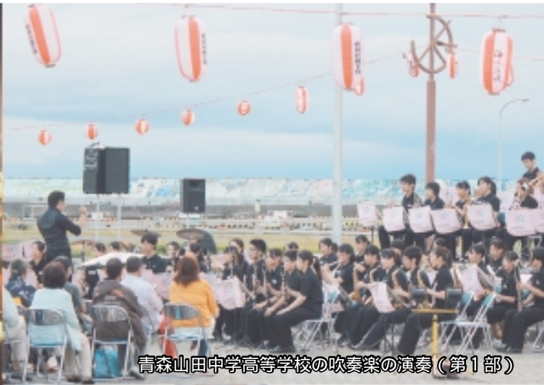
青森山田中学高等学校の吹奏楽の演奏（第1部）