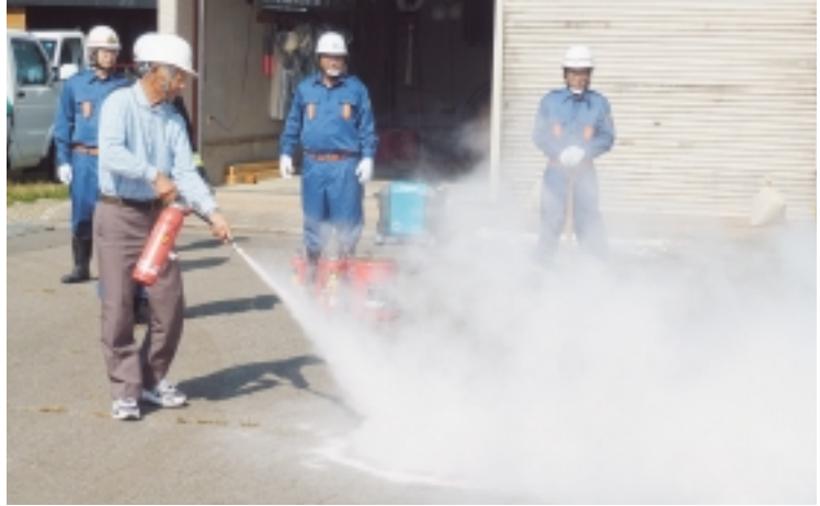
昨年度、原田地区にて行われた消火訓練の様子

9月27日(日) 村内全域を対象に佐井村防災訓練を実施します。災害から身を守るための訓練ですので、住民の方々の参加をお待ちしております。