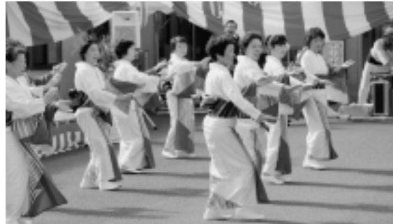
大間町歌夢歌夢レディース