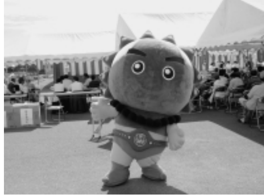
ゆうなぎの里の夏祭りに出没