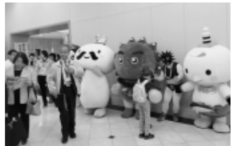
健康アップフォーラム 来場者出迎え中