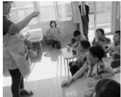
エプロンシアター。 みんな真剣に聞いていました。

また、保育所では第4回むし歯予防教室を行いました。これまで学んだ内容で○×クイズを行ったところ、正解を発表ごとに大きな歓声があがっていました。また歯磨き実習では回を重ねるごとにだんだん上手に磨けるようになっていました。