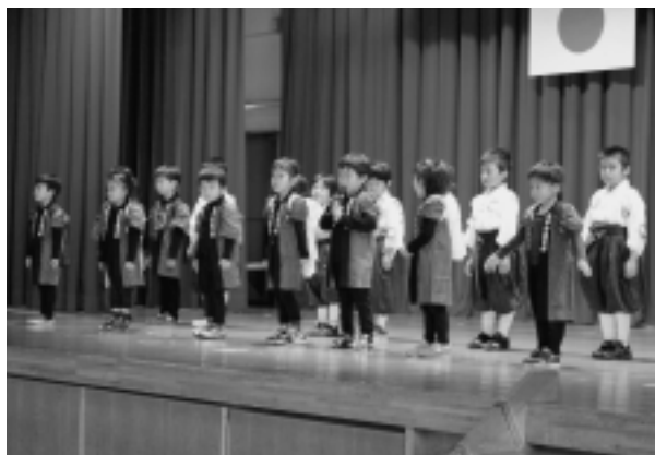
佐井村保育所児童による発表