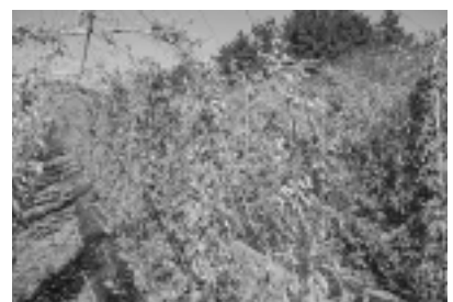
枯れてきたアピオス畑

中でも、佐井村のアピオスは甘いことが特徴で、アピオスを知っている方でも、試食すると甘いことに驚かれることが多いようです。