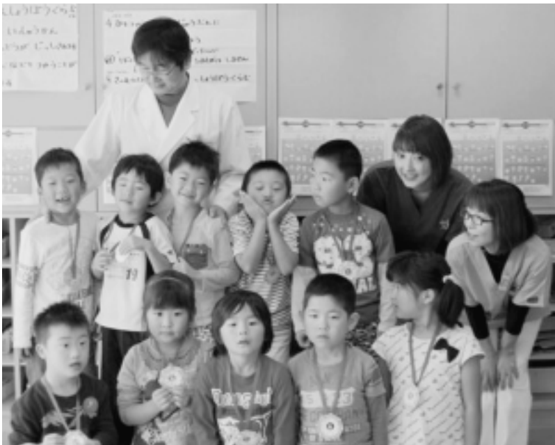
みんなよく頑張りました。修了証を首にかけて記念写真。