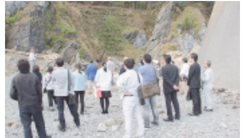
東通村でのジオツアーの様子

ジオパーク推進協議会では、各地区におけるジオツアーを考えており、今回、11月3日(火)にツアーが行われます。すでに募集はメ切っており、今回のツアーへの参加はできませんが、次回、ジオツアーが行われた際には参加してみませんか？