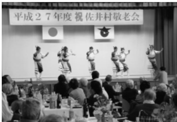
佐井婦人会による踊り

村内在住の75歳以上の高齢者約120名が参加され、佐井村保育所児童による御神楽や元気いっぱい遊戯、佐井婦人会による余興や参加者のカラオケなど、和やかな雰囲気の中、楽しい一日を過ごしました。