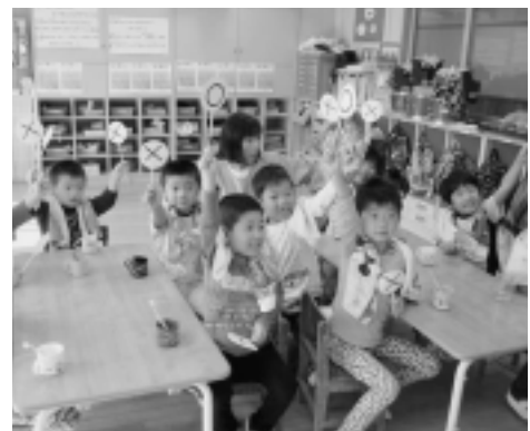
元気に解答。さて、正解は？