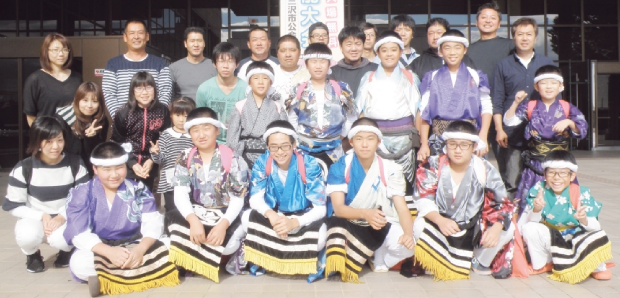
【10月4日(日) こども民俗芸能大会】