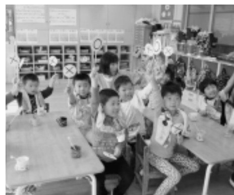
元気に解答。さて、正解は？