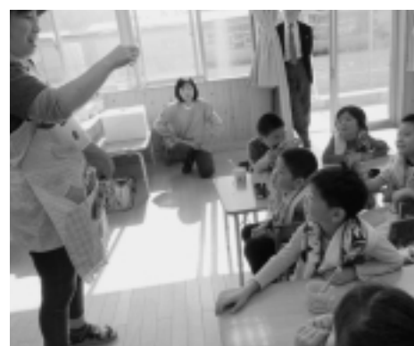
エプロンシアター。 みんな真剣に聞いていました。

また、保育所では第4回むし歯予防教室を行いました。これまで学んだ内容で○×クイズを行ったところ、正解を発表ごとに大きな歓声があがっていました。また歯磨き実習では回を重ねるごとにだんだん上手に磨けるようになっていました。