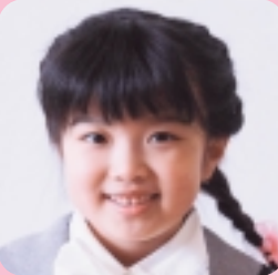
①さが なみね ②おいしやさん