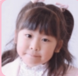
①たてわき ねね ②どうぶつえんのしいくいん