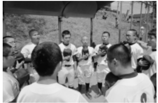
佐井中学校野球部