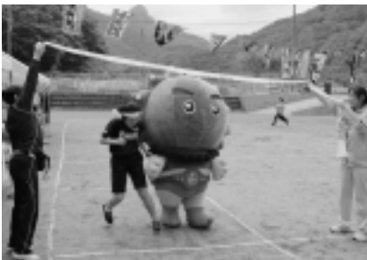
二人三脚で走る雲丹(うんたん)

うに祭りでは、下北のご当地アイドル『まさかり☆Girls 5』と共演し、“Let's Go うんたん”のダンスを踊りました。また、うに祭りに来てくださった方々とたくさん写真を撮りました。