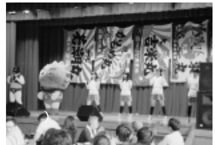
“Let's Go うんたん”を踊る雲丹(うんたん)