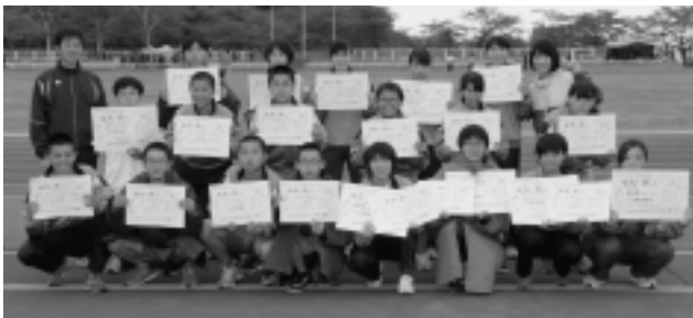
佐井中学校陸上部