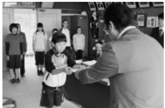
村長が1人ずつ委嘱状を交付

9月7日(水)～9日(金)の北海道方面への修学旅行に合わせ、手作りのパンフレットなどで佐井村のPRをする「ふるさと大使」として活動します。委嘱期間は9月30日までです。