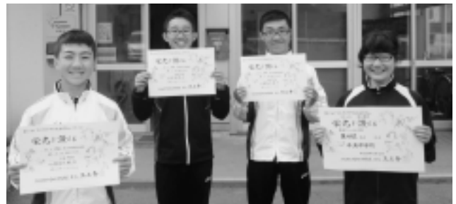
牛滝中学校陸上部