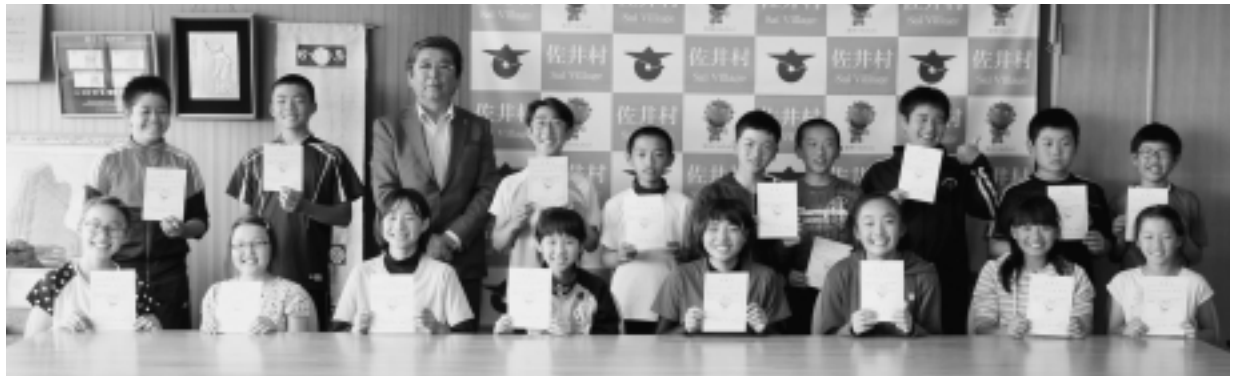
佐井村小学生ふるさと大使のみなさん