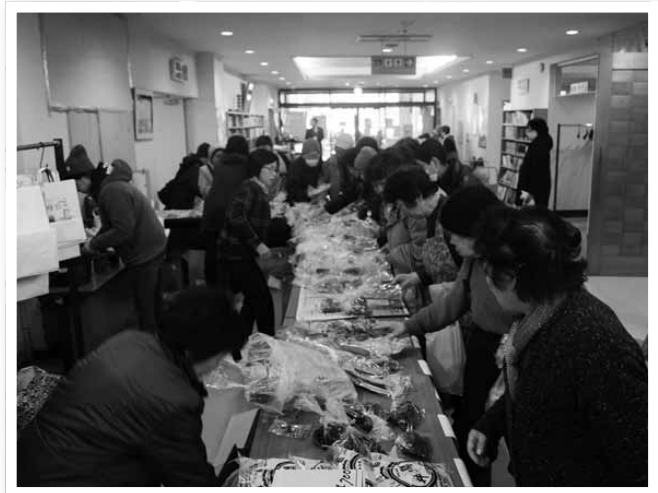
海産物などの販売