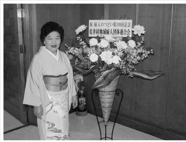
第30回を記念し地婦連から村に寄贈されたシルクフラワー