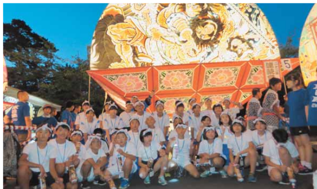
弘前ねぶたまつり

1日目は東目屋ねぶたに参加し声が枯れるほど「ヤーヤドー」と叫び、2日目は水陸両用バスに乗車するなどして、西目屋村の小学生と交流を深めました。