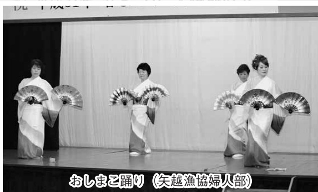
おしまと踊り (矢越漁協婦人部)