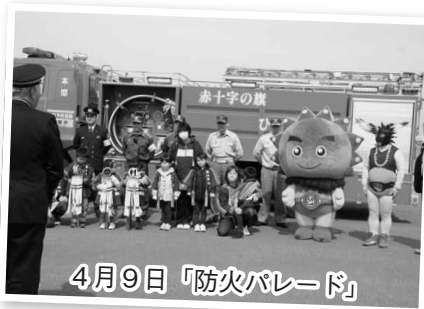
4月9日「防火パレード」

雲丹（うんたん）が佐井村に来て6年が経ちました。村内のイベントはもちろん、村外でも佐井村をPRするために頑張っています。今回は昨年度の雲丹（うんたん）の活動を写真で振り返ります。