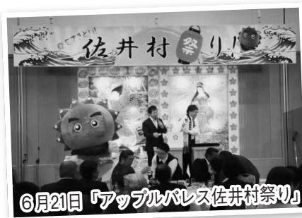
6月21日「アップルバレス佐井村祭り」