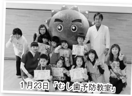
1月23日「むし歯予防教室」

雲丹（うんたん）にイベントや行事に来てほしい場合は、総合戦略課までお問合せください。