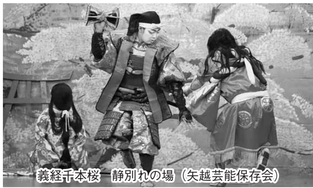
義経千本桜 静別れの場 (矢越芸能保存会)

「三番叟」「平獅子」「祭囃子」「手踊り」「歌舞伎 義経千本桜」など数多くの演目が披露され、村内外からのたくさんのお客さんで会場が賑わいました。