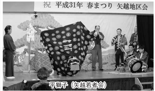
平獅子 (矢越若者会)