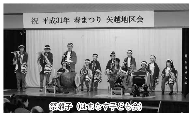
祭囃子 (はまなす子ども会)