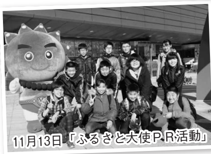
11月13日「ふるさと大使PR活動」