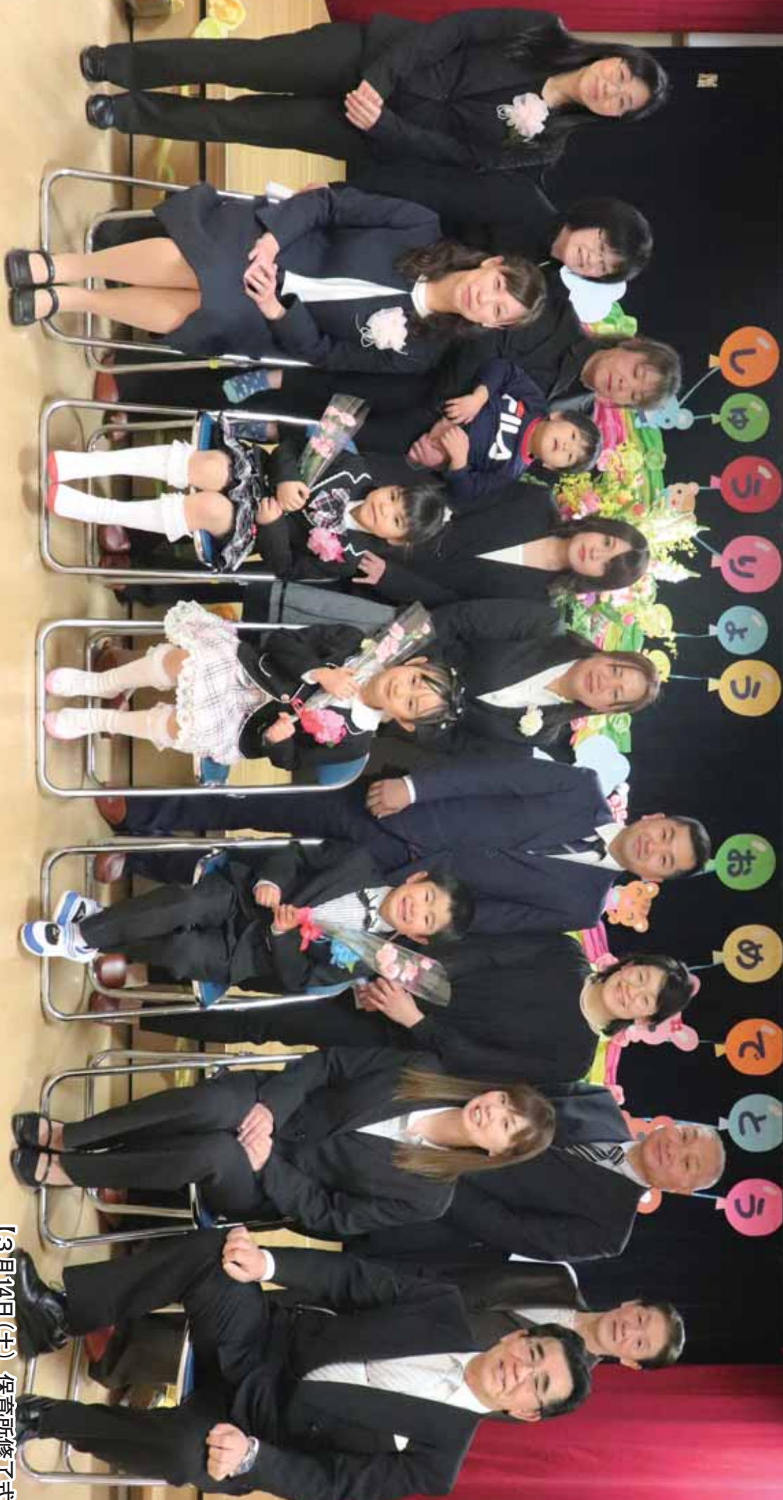
【3月14日(土) 保育所修了式】

the most beautiful villages in Japan 佐井村 SAIKI-MURA