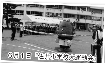
6月1日「佐井小学校大運動会」

雲丹（うんたん）にイベントや行事に来てほしい場合は、総合戦略課までご相談ください。