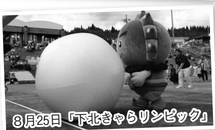
8月25日「下北きゃらリンピック」