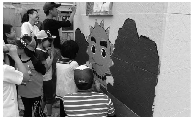
平成30年度 矢越地区バス待合所整備事業