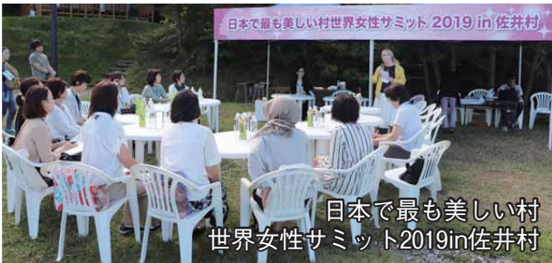
日本で最も美しい村 世界女性サミット2019in佐井村

東北の美しい村加盟町村から6団体が集まり、女性が活躍できる地域づくりや地域住民の参加を促進することを目的に参加者がゆるくつながるネットワークを築き、学びの場を創出するため開催した。