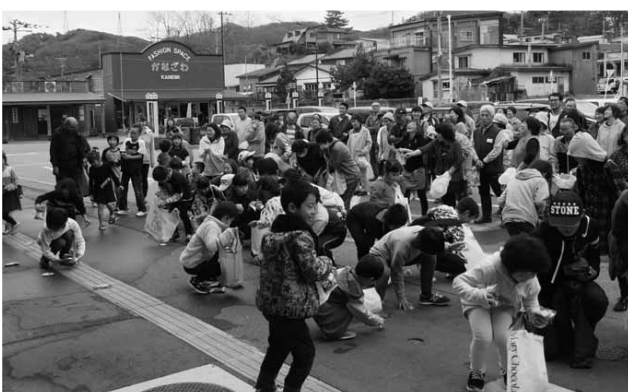
令和元年度 おさかな祭り（餅まきの様子）