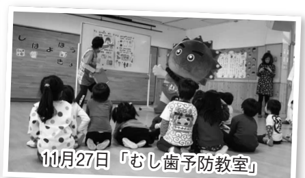
11月27日「むし歯予防教室」