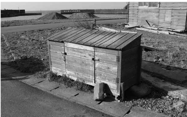
平成25年度 長後地区ゴミステーション整備事業