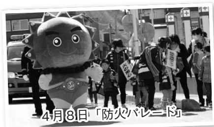
4月8日「防火パレード」