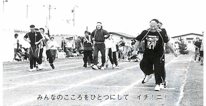
みんなのこころをひとつにして イチ!ニ!