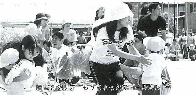
障害をクリア もうちょっとでゴールだよー