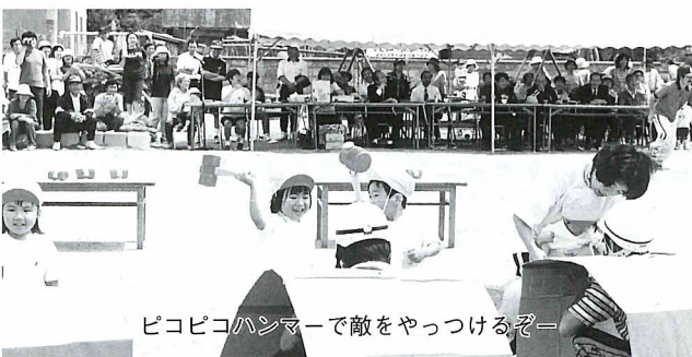
ピコピコハンマーで敵をやっつけるぞー