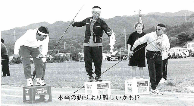
本当の釣りより難しいかも!?