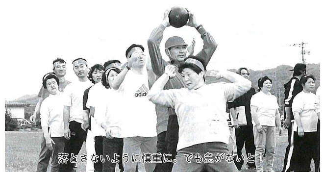
落とさないように慎重に。でも急がないと!