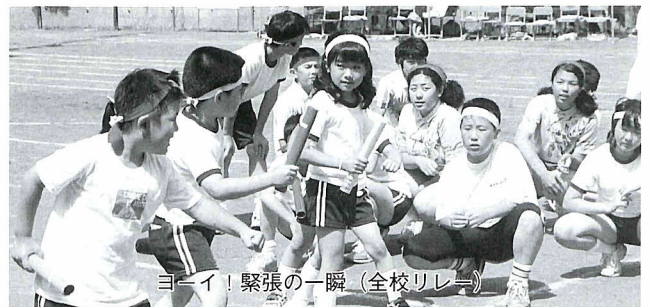
ヨーイ! 緊張の瞬間(全校リレー)