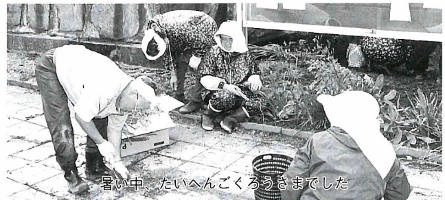
暑い中、たいへんごくろうさまでした

6月21日(木)、両佐井地区老人クラブ寿会のみなさんが、役場周辺の草刈りを行いました。この日も、真夏思わせるような暑さでしたが、汗だくになりながらも、熱心に作業していました。