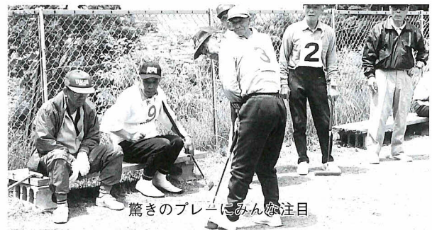
驚きのプレーにみんな注目