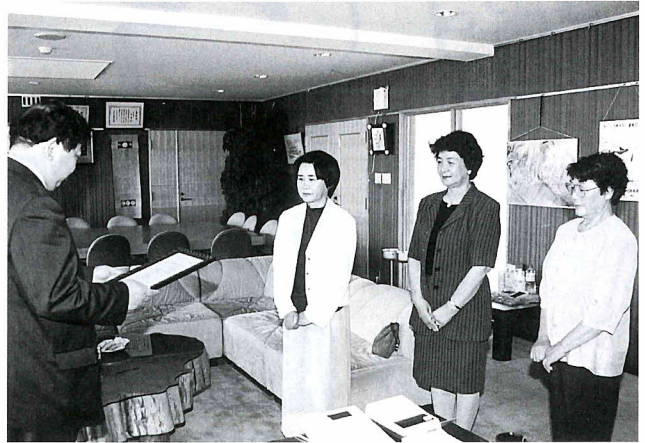
村長室での授与式の様子

5月から10月の観光シーズンには、実演と即売会も行っており、手づくり物のブームと相まって評判が良く、年々、作り手、買い手、ともに愛好者が増えています。