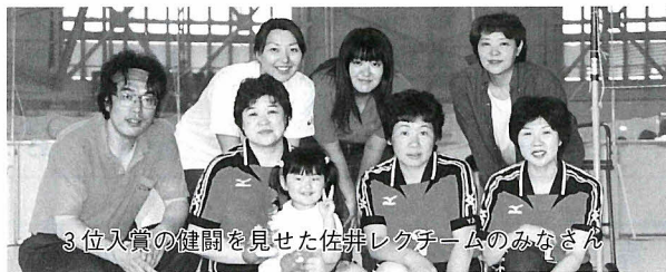
3位入賞の健闘を見せた佐井レクチームのみなさん