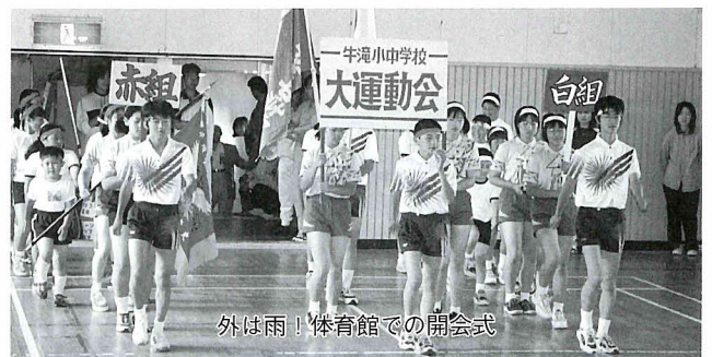
外は雨! 体育館での開会式