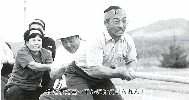
まだまだ若いモンには負けられん!