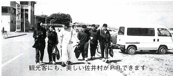
観光客にも、美しい佐井村がPRできます

佐井村を訪れた人たちが気持ちよく過ごせるよう、ごみのポイ捨てをしないように心がけましょう。