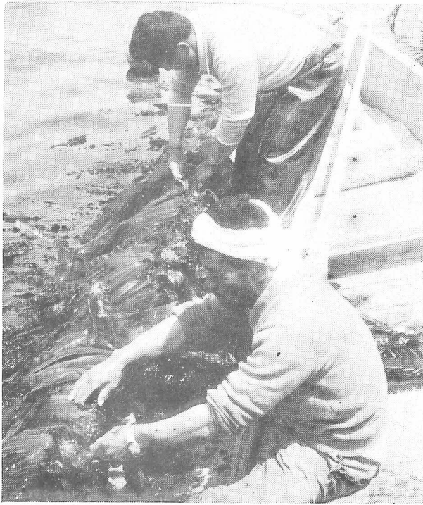
養殖コンブの間引

「採る漁業から造る漁業」へと近年急速に変わりつつある漁業も全国的に拡大されて来ている今日、わが佐井村も二年前から試験を続けて来たコンブ養殖が成功し試験研究から企業化へと切り替え、昨年十二月に研究会が主体となって促成種苗と天然種苗で、原田、佐井、矢越、磯谷に養殖施設、百五十ヶ統（一ヶ統五十メートル）設置して今年八月採取したが順調な成育でしかも良質で天然コンブにおとらぬ高値で売買されました。この内促成栽培だけで一万キロ、金額で五百万円予定されています。