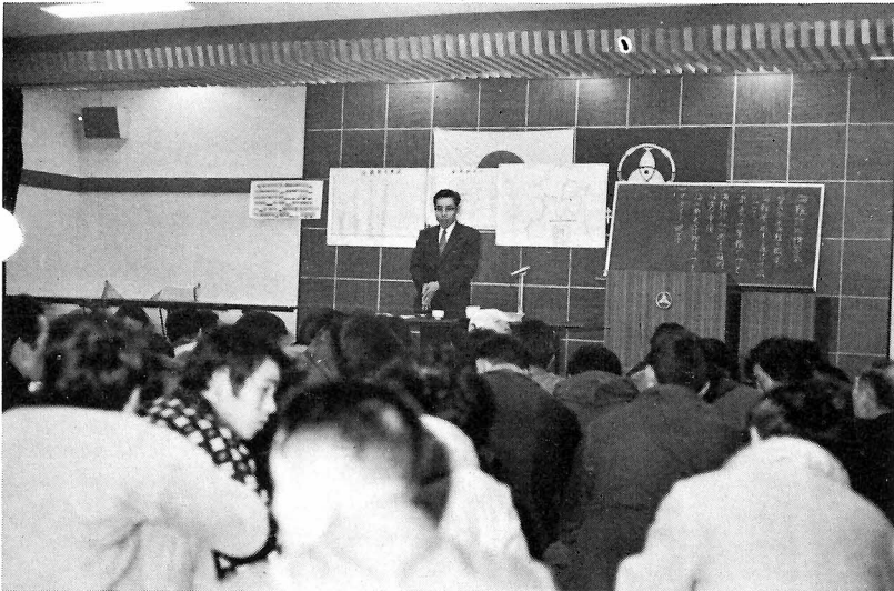
海難防止講習会光景

一月二十三日、漁業協同組合大 会議室で海難防止講習会が、県水 産課主催で開かれました。 海上保安部から講師を招いて、 海上衝突予防や気象予報の見分け 方あるいは海難防止に関する一般 的事項についての講習会が開かれ 受講者約百名は、日頃の海難に対 する自分達のあり方について、熱 心に耳をかたむけていました。 最近、沿岸における小型船舶の 海難事故がひんばんに発生してい る事もあって、天候異変の場合の