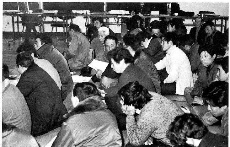
海難防止講習会光景

早期避難の励行や 特に本県において 事故の多い船火事 については充分気 をつけて未然に防 止するよう、海上 保安部から強い要 望がありました。