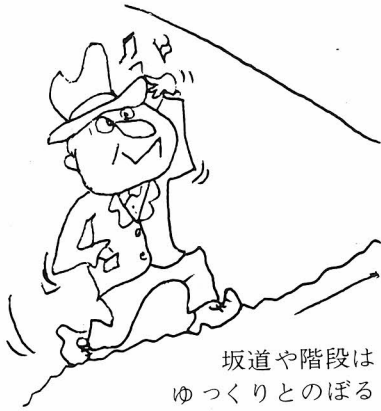
坂道や階段は ゆつくりとのぼる

四十歳以上になったら血圧を測りましょう。仕事のあいまに体操をし体をきたえましょう。