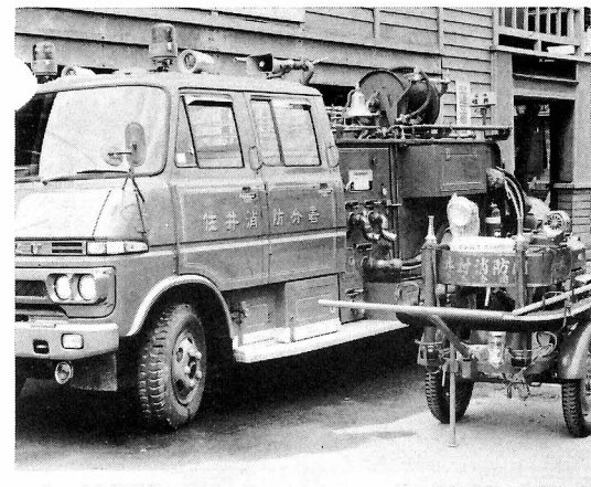
【購入されたタンク車・動力ポンプ】

八月二日に、消防ポンプ自動車一台が分署に、可搬式動力ポンプ一台が原田に備えつけられました。これからの消防は機動力で、ということは皆さん日頃から感じていることだと思います。最近、ガスや灯油を使う家庭が多く、取り扱いはちよつとでもまちがうと、すぐ火事になりみるみるうちに大きな事故になります。購