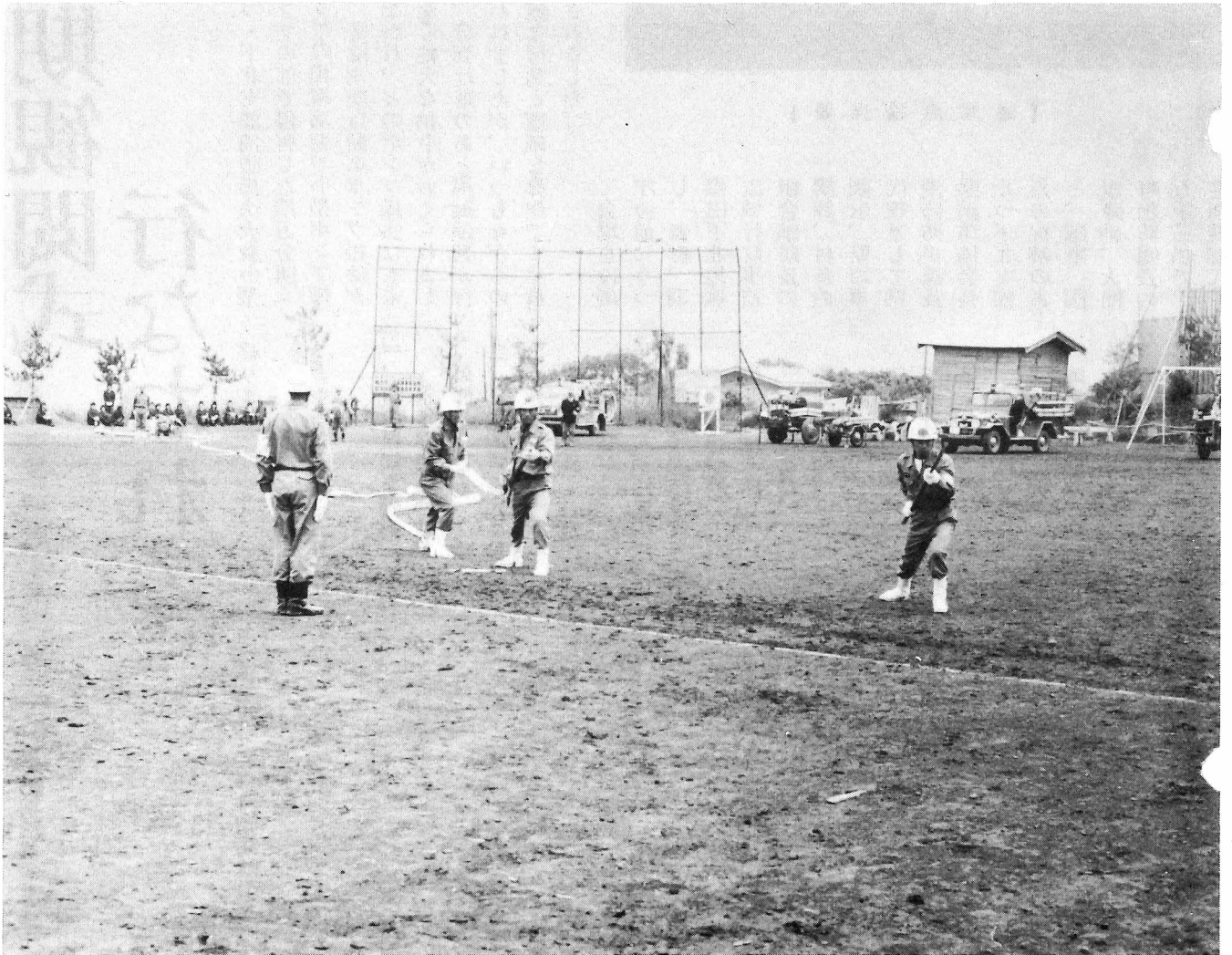
【観閲式模擬演習（第5分団）】