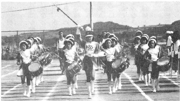
評判の高かった小学校鼓隊