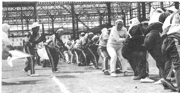
楽しい応援、あふれるパワー